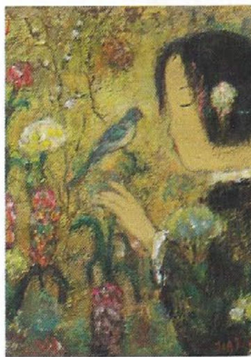
JIA JUAN LI Dans le jardin 2008, huile sur toile, 35 x 27 cm.

Qu'elles soient dans un jardin, dans un intérieur de palais ou sous forme de portraits, les femmes de Jia Juan Li sont toutes rêvées, «célestes». Qui sont-elles ? Des témoins d'un temps passé, mélange «des récits sur la condition féminine de la Chine ancestrale, imprégnés par les souvenirs familiaux de l'artiste», nous livre Serge Lipao. Elles évoluent dans un univers empli de sérénité et de solitude silencieuse. Le corps toujours dissimulé sous d'épaisses draperies, elles sont déclinées en une vingtaine de toiles exposées jusqu'au 7 mars sur les murs de la jeune galerie.