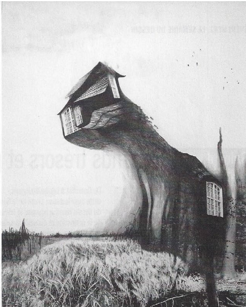
PATRIZIA LIGUDA Sans titre 2009, collage et dessin, 83 x 59 cm.

Dessins de Victor Hugo Exposition des pépites des ventes de mai et juin, à (re) découvrir dont un lavis de Victor Hugo autour de 150 000 €, et des dessins contemporains. Christie's, du 23 au 26 mars • www.christies.com