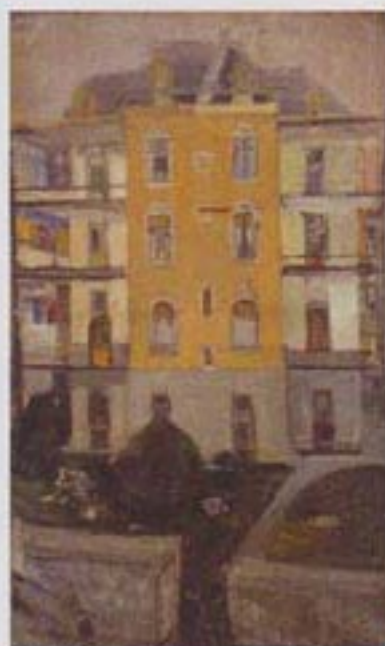
VARLIN Maison à Beckenholzstrasse, 1964. Huile et pigment sur toile. 175,5 x 105 cm.