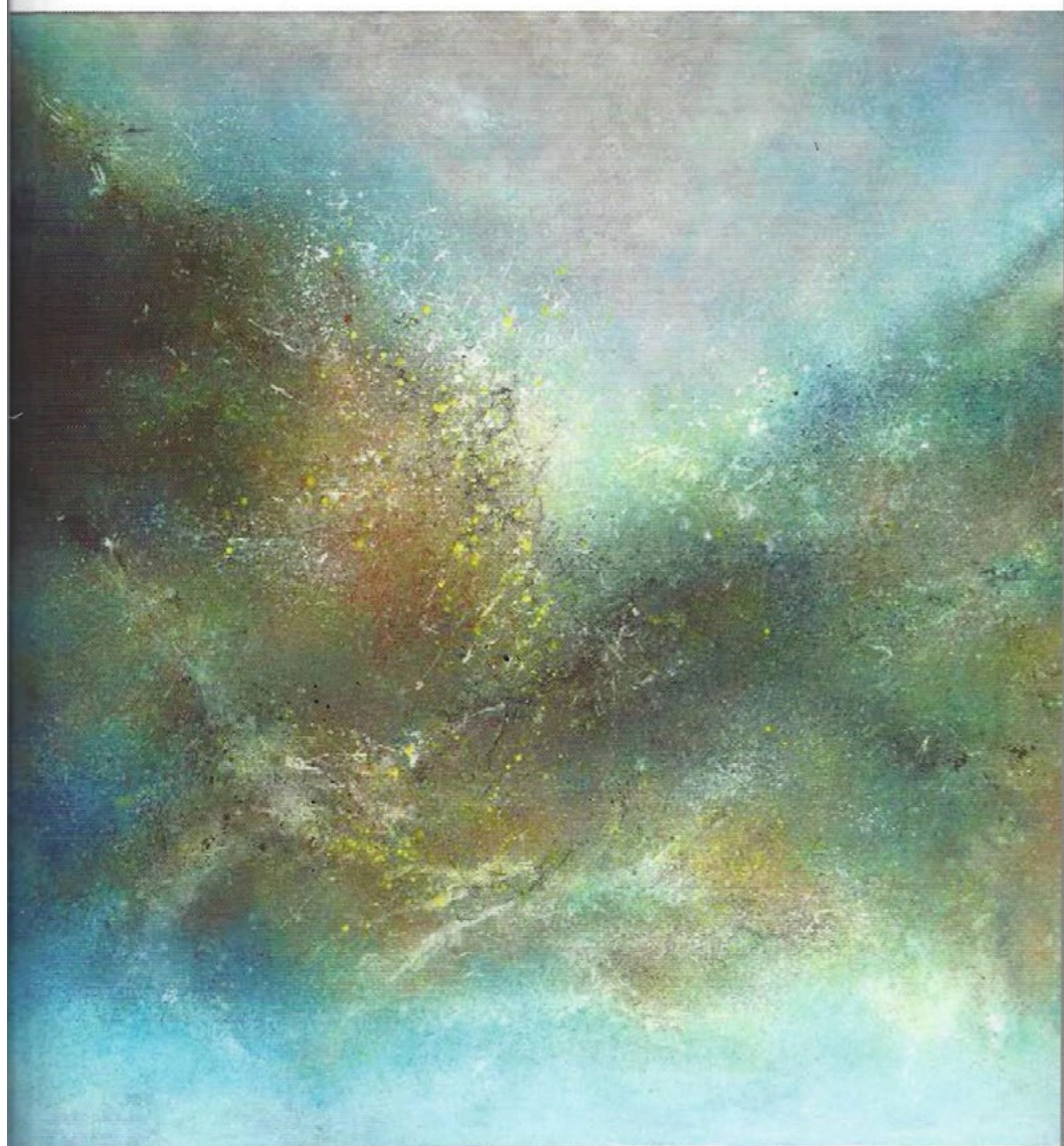
COSMINA, Sans titre - Réf. 02-14, huile sur toile, 100 x 100 cm - Galerie Visio Dell'Arte - Paris