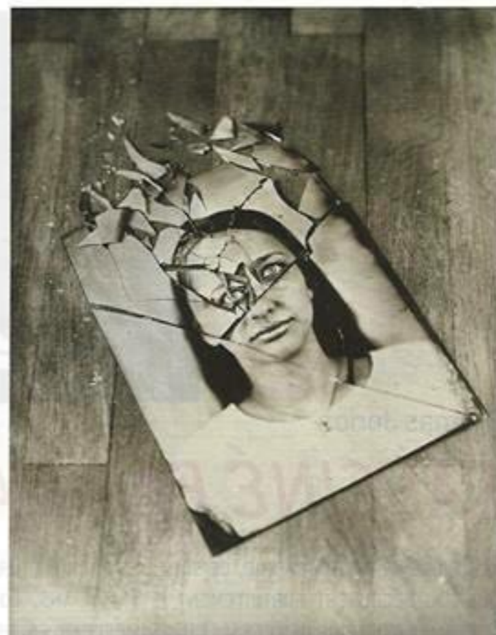
Eric Antoine, Le suicide , 2015, ambrotype

Artisan et artiste, procédé photographique ancien et regard neuf, savoir-faire d'un technicien et talent d'esthète sont des paradigmes a priori antinomiques. Toutefois, ils tendent à s'accorder à l'unisson dès que notre regard découvre l'œuvre photographique d'Eric Antoine.