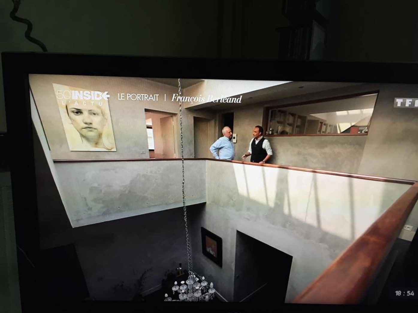
50 minutes Inside 25 avril 2015 - François Berléand